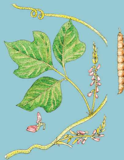
Kudzu (lat. Pueraria lobata)

Aminokyseliny 6 L-glycin 7 , L-ornitin 8 a L-aurin 9 jsou základními stavebními kameny bílkovin.